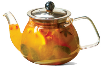
Չիչխասի թեյ 0.5 / 1 լ Облепиховый чай 0.5 / 1 л 1800/3000