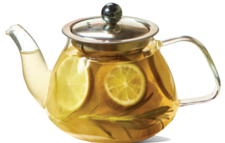
Կոճապղպեղի թեյ 0.5 / 1 լ Имбирный чай 0.5 / 1 л 1500/2500