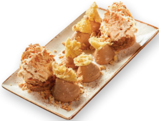
«Սնիկերս» ֆիրմային Фирменный «Сникерс» 3300