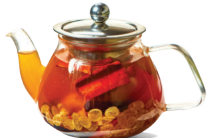
Աշնանային Նոկտյուրն 0.5 / 1 լ Осенний Ноктюрн 0.5 / 1 л 1800/2700