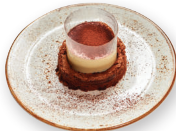
Շոկոլադ վանիլա Шоколад ванилла 3300