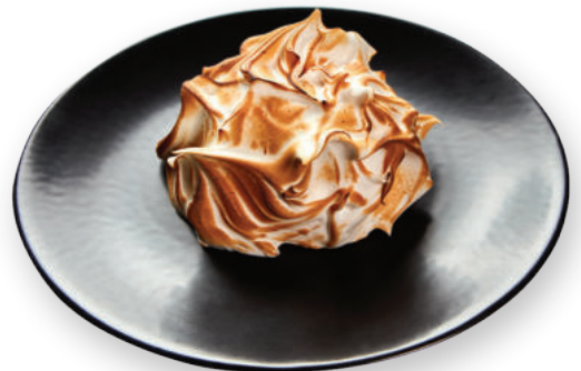
Դելիս ագնվամորիով Делис с малиной 2400