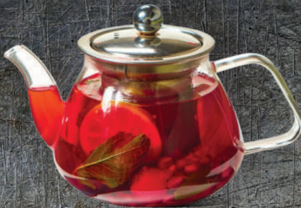
Նռան թեյ 0.5 / 1 լ Гранатовый чай 0.5 / 1 л 1900/2800