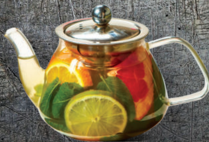
Ցիտրուսային թեյ 0.5 / 1 լ Цитрусовый чай 0.5 / 1 л 1500/2500