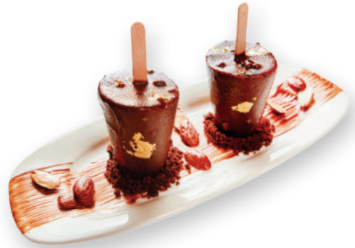
Էսկիմո Эскимо 4200