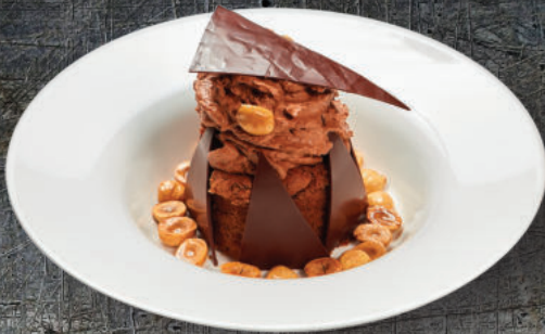
Շերբի Шереп 3200