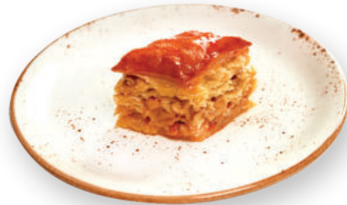
Գավառի փախլավա Гаварская пахлава 1400