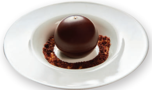
Շոկոհոլիկ Шокоголик 3200