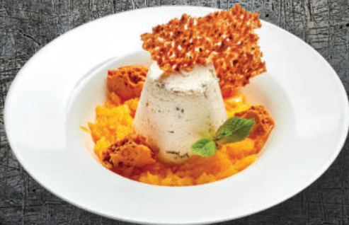
Կասատա անուշեղենով Касата с орехами и сухофруктами 2900