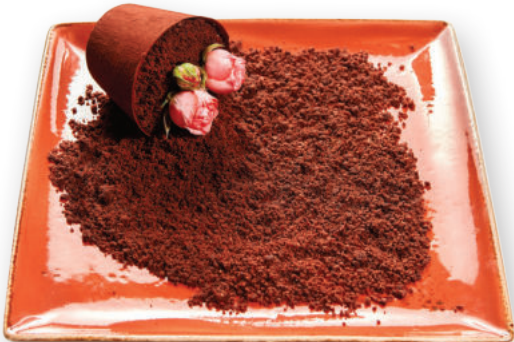
Կտրված ծաղկաման Разбитый горшочек 3500